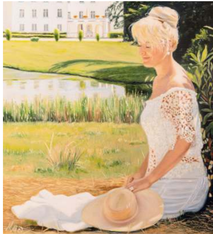
La rêveuse, Château de Losange, de Nathalie Medernach