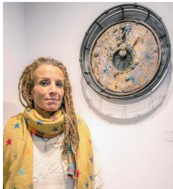
L'artiste Sabine Toussaint