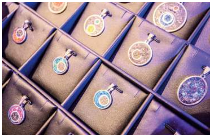
Bijoux faits main de David Giacomini