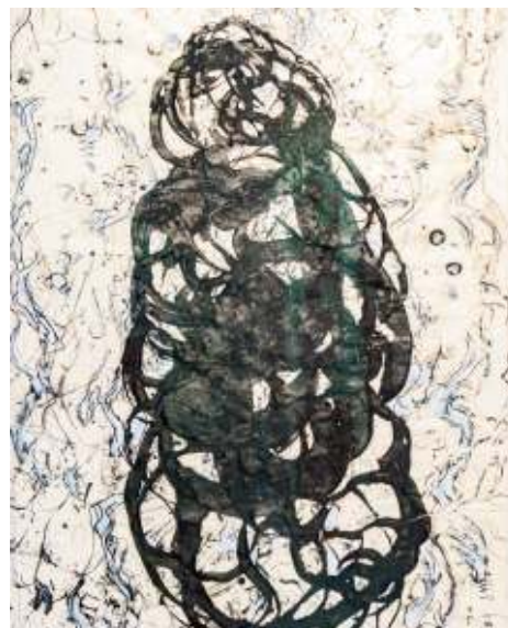
Noir sur Blanc, de Jeanne-Marie Simon