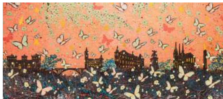
Millermolier, de Nadia Schreiner