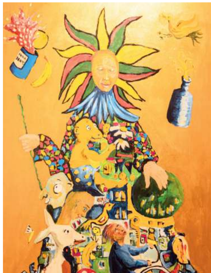
La Reine de Tout, de Marc Graas