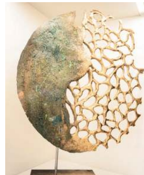
Pierre de Lune; de Sabine Toussaint