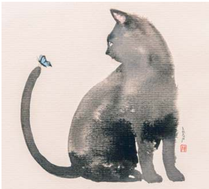
Cat, de Huan-Chih Lee

Sous l'égide du Syndicat d'Initiative et de Tourisme de Walferdange, dix artistes montrent une belle sélection de leurs œuvres à l'Espace-Galerie CAW à Walferdange, au 5, route de Diekirch. Le CAW est ouvert le jeudi et vendredi, de 15 à 19 heures, ainsi que samedi et dimanche, de 14 à 18 heures.