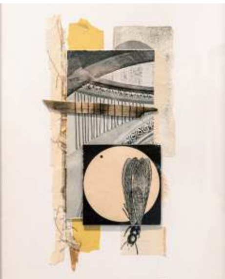
Wunderbares Wesen, d'Estelle Lichtenberger